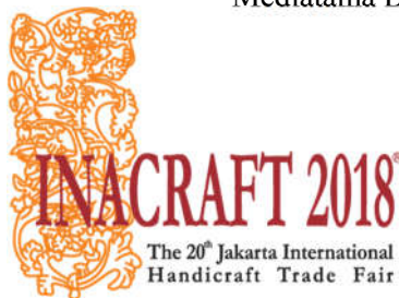
Gambar 1 Logo Inacraft 2018

Pameran The Jakarta International Handicraft Trade Fair atau dikenal dengan Inacraft merupakan pameran kerajinan skala internasional yang dilaksanakan pada bulan April setiap tahunnya yang diselenggarakan oleh PT. Mediatama Binakreasi di Jakarta Convention Center (JCC). Inacraft semula merupakan pekerjaan dari PT. Expose Praga Promo yang baru pertama kali diselenggarakan di tahun 1999. Dengan keanggotaan yang masih sangat minim, berkat ketekunan dan kerja keras Inacraft semakin berkembang dan anggotanya semakin besar hampir seluruh daerah di Indonesia. Bahkan sekarang Inacraft menjadi signature event dari PT. Mediatama Binakreasi.